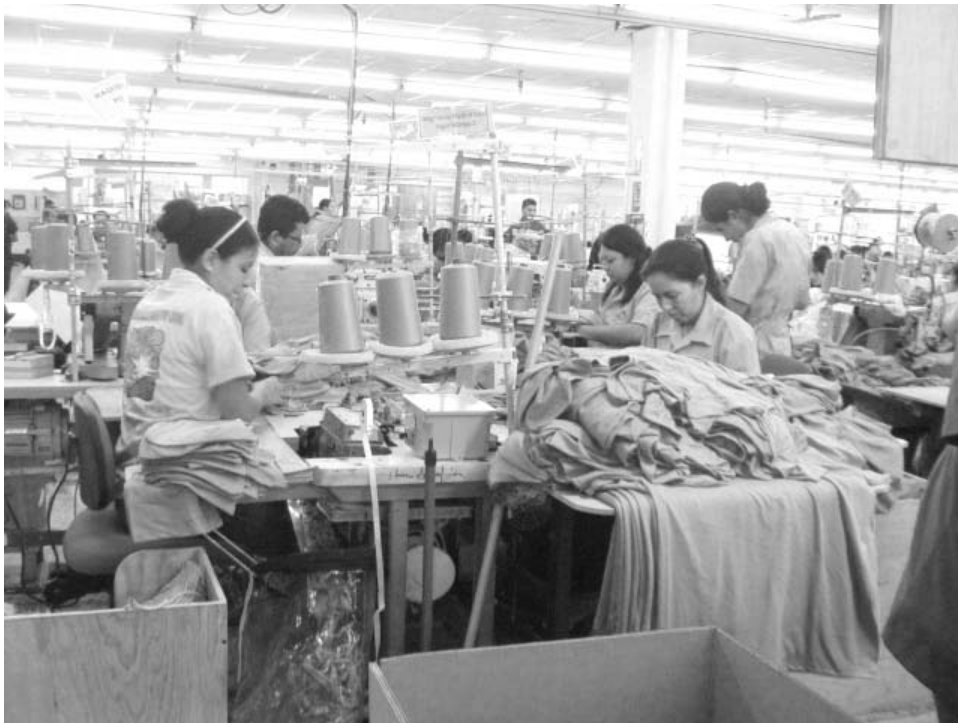
En las maquilas, los trabajos se han intensificado: quien más produce, más gana.

Sin organización sindical ni contratación colectiva, la clase trabajadora no tiene cómo defender sus derechos. Hay casos de represión a líderes sindicales, y son muchas las personas que son despedidas de los centros de trabajo por pretender organizar un sindicato.