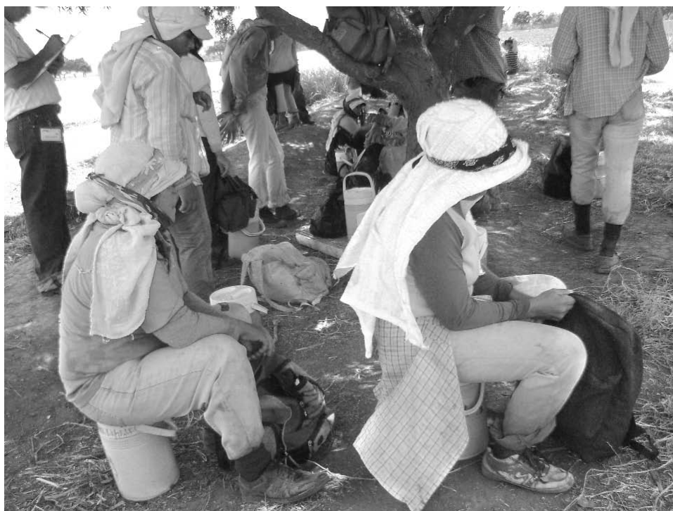
Trabajadoras de las meloneras consumen sus alimentos a la intemperie, cerca de los productos químicos.

No hay cafeterías donde tomar los alimentos, lo que obliga a los y las trabajadoras a consumirlos de pie. Los que trabajan en el campo tienen que hacerlo bajo el ardiente sol o la lluvia, y las jornadas sobrepasan los tiempos que establece la legislación hondureña.