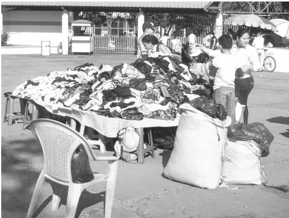
En el norte de Honduras proliferan las actividades de la economía informal.